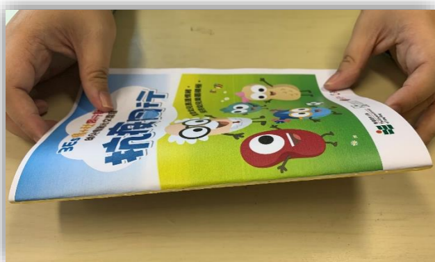
把橡膠圈套置書脊位置