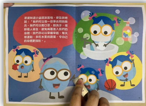
翻轉圖書，利用尺子協助按平