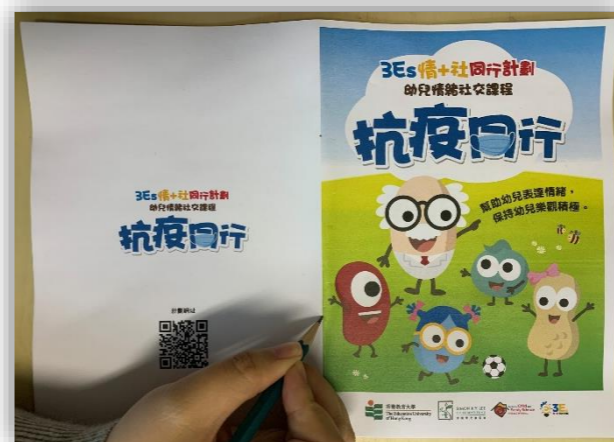
在書脊上作釘裝記號