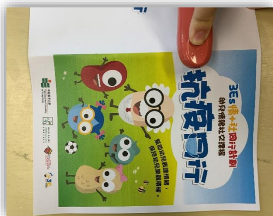
在記號位置釘一口釘