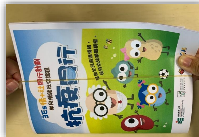
打開圖書，把橡膠圈套上