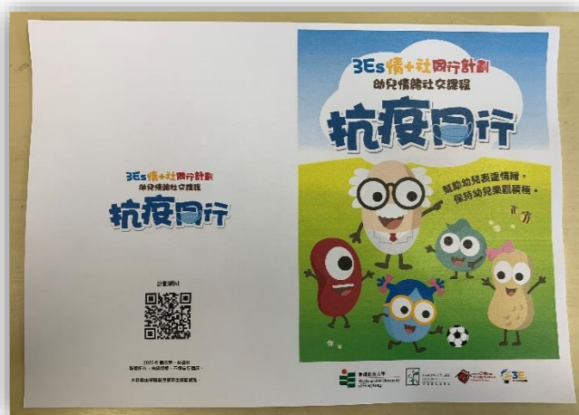
列印雙面故事書（短邊翻轉）