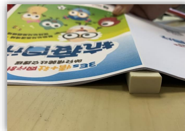
把橡皮擦放置在記號下