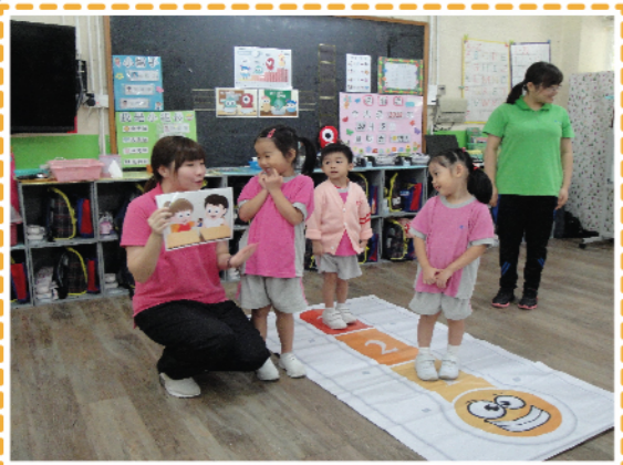
透過遊戲，讓幼兒認識及表達情緒