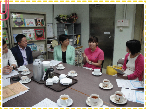
麥校長的團隊分享推行課程計劃的點滴