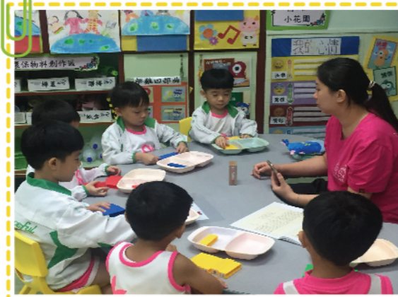
透過小組活動，培養幼兒的專注力